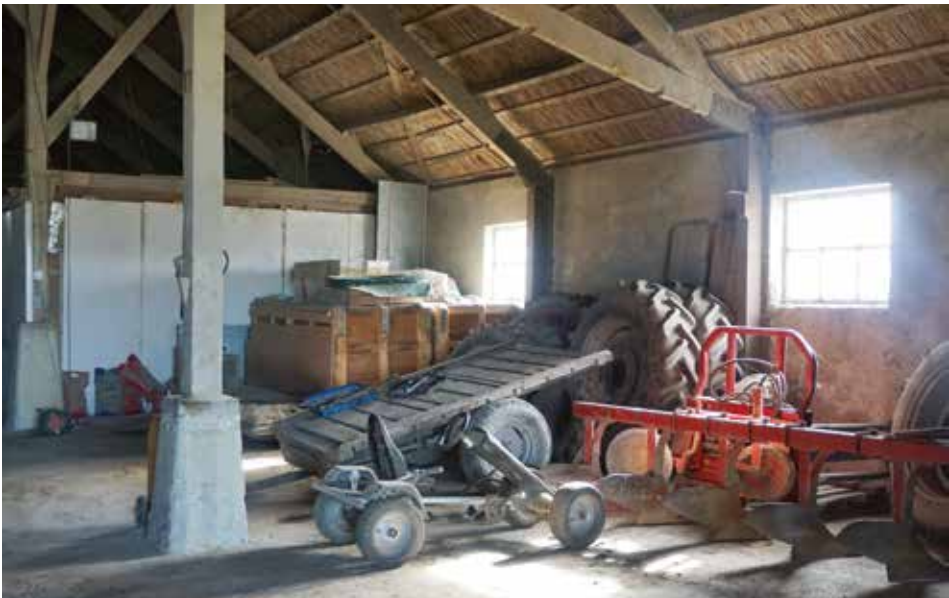
Deel van de stal