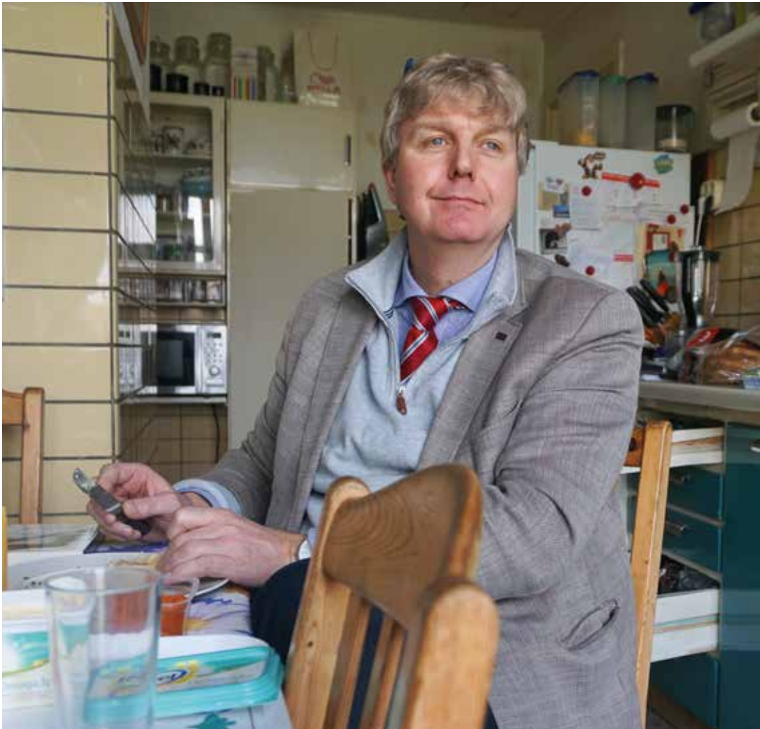
De typische Bruynzeelkeuken uit 1953 van boerderij klein Vennep

te wonen. We wonen in het paradijs.” Dat paradijs staat al decennialang onder druk. De gemeente Haarlemmermeer is even lang in de weer om de verschuiving van de stad over het land in goede banen te leiden. Ze ziet naast de (bepaalde) agrarische functie